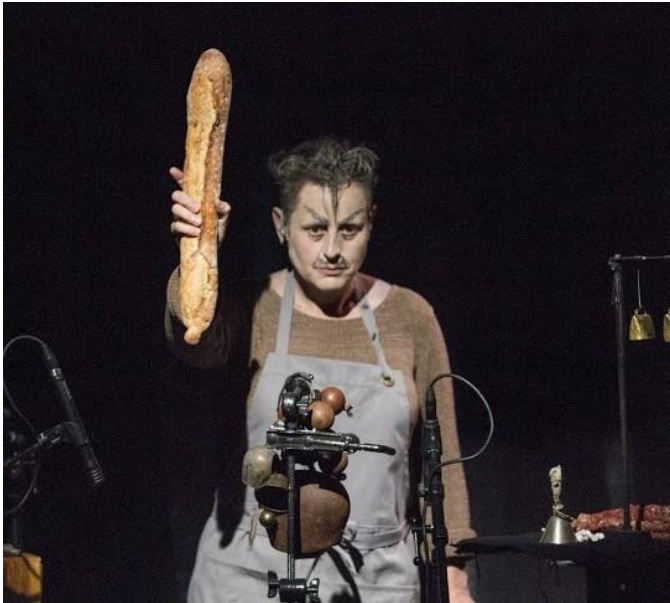
Sinon je te mange ©Marinette Delanné 2017

Mon aventure artistique avec Ilka a commencé avec La vieille et la bête en 2009, suivi par Sinon, je te mange... , puis Eh bien, dansez maintenant! créée en 2017 - onze années pendant lesquelles nous avons partagé la scène, les repas, les routes, les tournées. Onze années de découvertes et d'enrichissement artistiques à ses côtés.