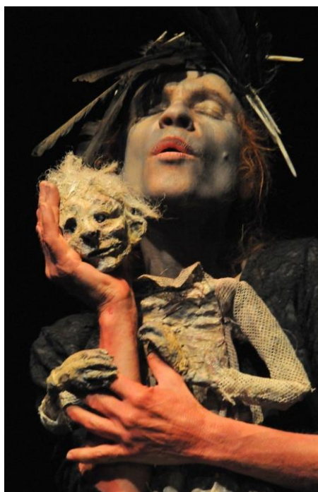
Eh bien, dansez maintenant!