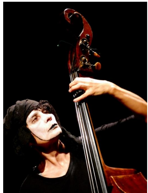
Voyage chimère ©Marinette Delannée 2021

Elle découvre son enthousiasme pour la mise en lumière au cours de sa participation en tant qu'artiste au sein du Women's Circus Melbourne, Australie en 2000. Puis elle travaille comme régisseuse lumière et son au théâtre Rex à Wuppertal, poursuit sa formation de technique du spectacle vivant à Cologne et obtient en 2009 le diplôme de régisseuse générale et lumière.