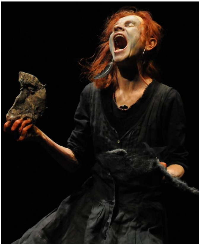
Voyage chimère