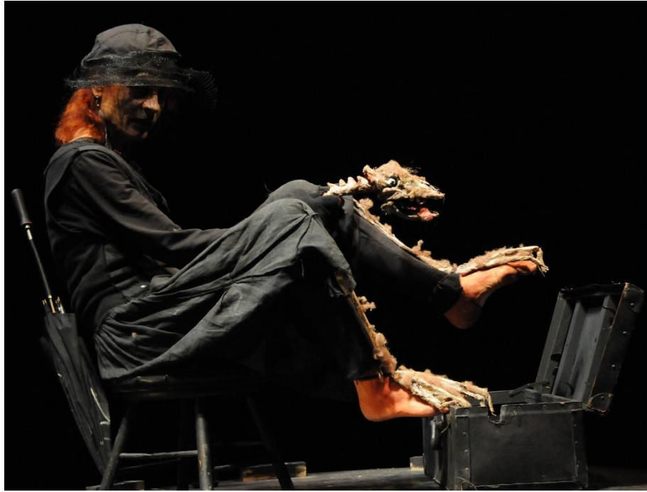
Voyage chimère ©Marinette Delanné 2021

Mesdames et Messieurs Nous sommes étonnés, nous sommes enchantés, nous sommes heureux que vous ayez trouvé l'entrée de notre petit cabaret si nombreux. Ce n'est pas le hasard qui vous a emmené dans cet endroit étrange et douteux Ce n'est pas par hasard si vous vous êtes égarés jusqu'ici au milieu de nulle part. Là, où le temps se tait, entre le pas encore et le plus jamais Là où les morts se préparent, se forment, se transforment se transfigurent, petit à petit, pas à pas, au fur et en mesure grâce à la magie de la musique en voyage chimérique.