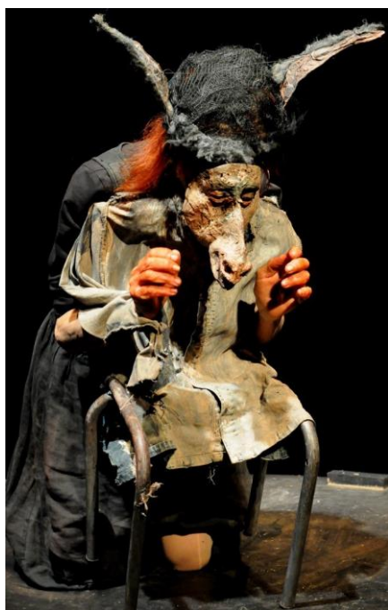
Voyage chimère ©Marinette Delanné 2021

Je voulais garder les quatre personnages. Seulement le chat est devenu une chatte et le coq une poule. C'est que la poule est un symbole encore plus frappant que le coq en ce qui concerne l'abus des animaux (et de la nature en général) par l'homme.