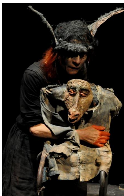
Voyage chimère