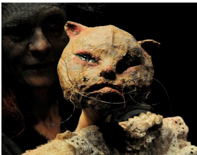
Voyage chimère ©Marinette Delanné 2021

Pendant la création de « La vieille et la bête » j'avais déjà rêvé de cette fanfare qui parle des vieux animaux de travail dont on voulait se débarrasser mais qui ont alors décidé d'échapper à la mort en devenant artistes itinérants, cheminant vers la ville de Brême.