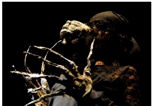
Eh bien, dansez maintenant!